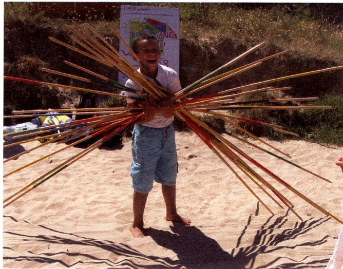
Été 2008 : grâce à la Caravane du jeu, les vacanciers ont pu connaître l'ACE.

Les liens devraient être étroits entre les membres de cette même famille qu'est l'Église. Les mouvements ne sont-ils pas nés d'ailleurs, pour la plupart d'entre eux, à l'intérieur même des établissements catholiques (cf. interview p. 33) ? Pourtant, au fil des ans, les relations se sont distendues, au point que des établissements peuvent méconnaître la péda-