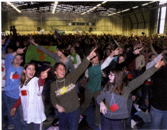
Un temps fort du MeJ : chants, prières, célébrations et... fête.

Si la proposition catéchétique retenue pour les 4 e /3 e dans un collège pourra être celle du MeJ, rien n'empêche ce même établissement de créer un groupe ACE en complément. Il ne s'agit plus cette fois « d'une proposition structurée de la foi », mais