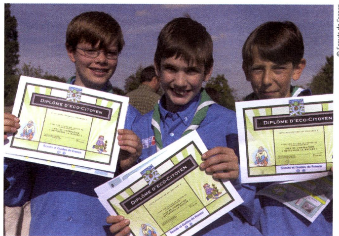
Scouts et éco-citoyens diplômés.