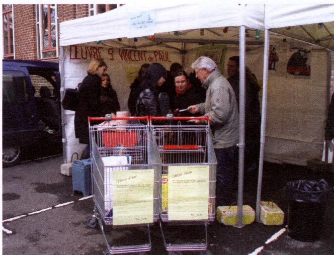
Des jeunes qui s'impliquent, c'est une bouffée d'air frais pour la CCSVP de Tourcoing.

À chaque mouvement donc, sa « coloration », ses objectifs et ses adeptes. Au lycée industriel et commercial privé 4 (LICP) de Tourcoing (Nord), une énorme structure de 3 500 élèves allant du primaire au post-bac, on a opté pour les Conférences Saint-Vincent-de-Paul (CSVP). À force de liens et de soutien à