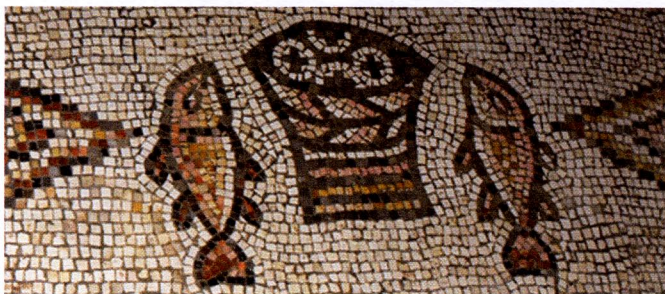
Cinq pains et deux poissons (mosaïque de Tabga).

« L'évangélisation est un labeur, qui devient facile lorsqu'on a confiance dans le dynamisme ecclésial. Quand le Christ nous dit : "Donnez-leur vous-mêmes à manger" , c'est l'Église qu'il désigne. Pour y parvenir, il n'y a pas de recettes. À chacun de partager ses cinq pains et ses deux poissons ! En revanche, il existe trois freins majeurs à la collaboration pour l'évangélisation : compter sur soi sans les autres, nourrir la défiance vis-à-vis des autres et ne pas croire au désir d'ouverture à Dieu de toute conscience humaine. Le travail ne manque pas... »