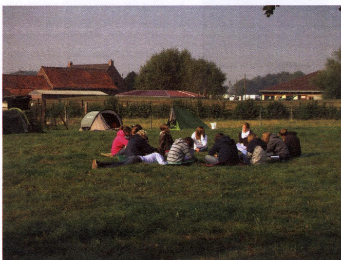
À Armentières, le Mej est un lieu de ressourcement reconnu par tous les enseignants.