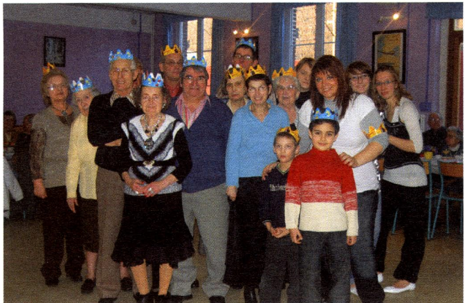
« Nous nous axons sur les animations. »